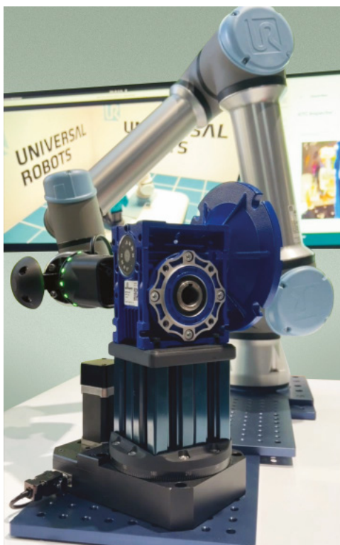
Gli sviluppi legati all'intelligenza artificiale fisica sono destinati, secondo Nvidia, a rivoluzionare l'automazione robotica