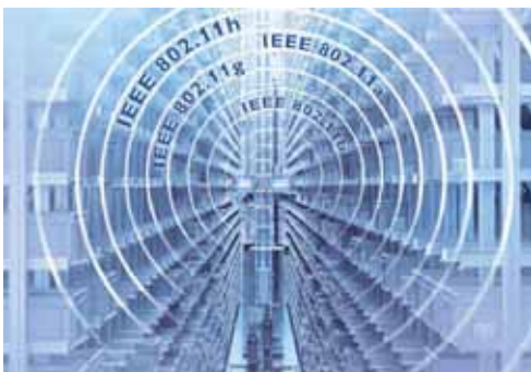
Speciale dedicato alla comunicazione wireless nell'industria