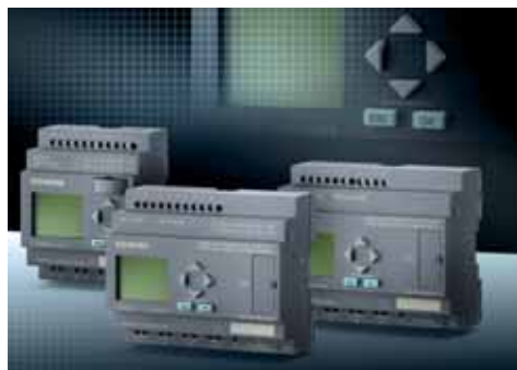
Le novità presentate ad Hannover da Siemens, ABB, Eaton e Weidmüller