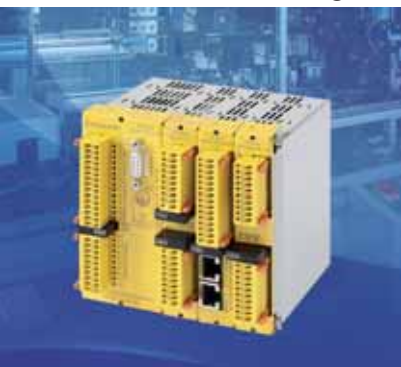
Controlli, moduli, sensori e interruttori per macchine sicure