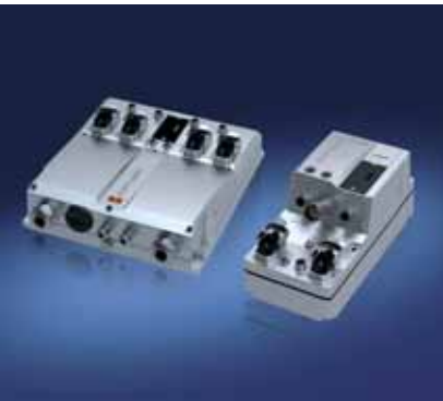
Inverter IP65-AcposMulti65 di B&R è una delle novità viste alla SPS di Norimberga