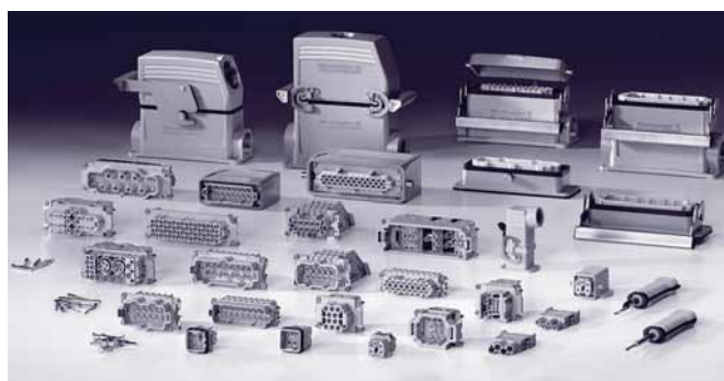
La gamma RockStar

veloce e diretto senza utensili, ma è comunque disponibile anche con collegamento a molla autobloccante, a crimpare, a vite. Le strisce isolanti integrate impediscono la trasmissione della tensione. Questo dettaglio è offerto in esclusiva su tutte le custodie.