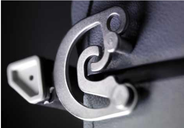
Un dettaglio: la molla a Omega

per ambienti corrosivi. Le custodie sono offerte con grado di protezione IP 65 e IP 69k e soddisfano la normativa NEMA 250-1991 Tipo 4x a tutto vantaggio delle aziende che esportano la loro produzione.