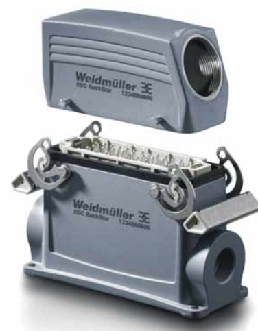
Il meccanismo di chiusura

RockStar è studiato per il collegamento con la tecnica Push In che permette un inserimento